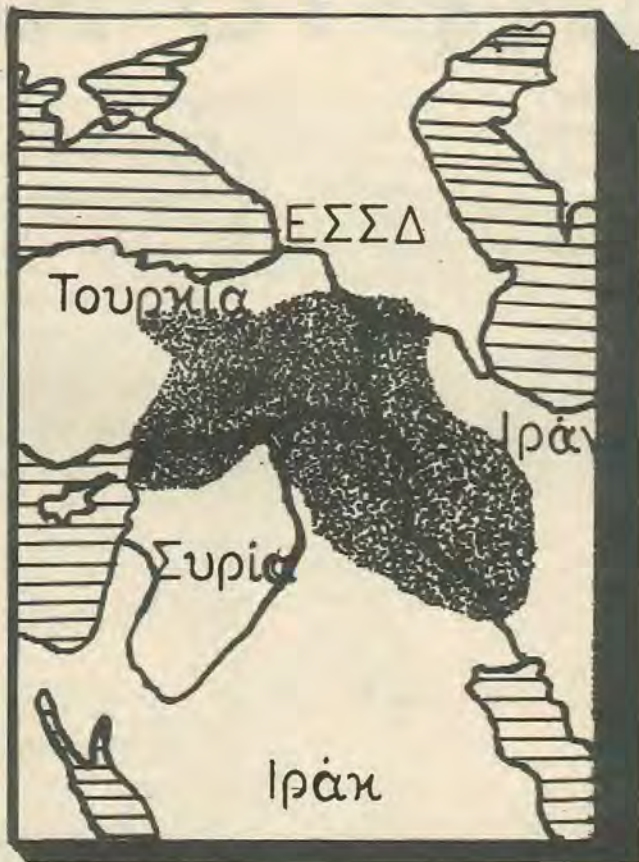
Χάρτης που δείχνει με σκούρο χρώμα την έκταση του Κουρδιστάν

βάρβαρης καταπίεσης όλων των εθνικών τους μειονοτήτων.